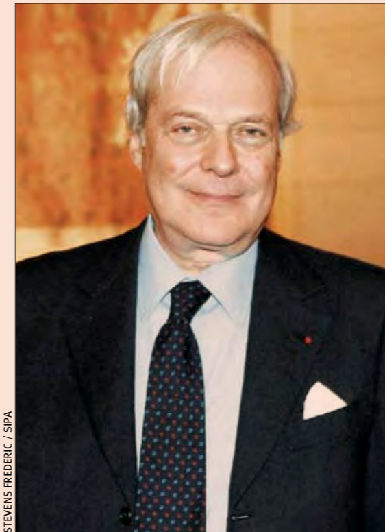
David de Rothschild : "2008 sera très largement fonction de ce qui se passera dans le système bancaire."