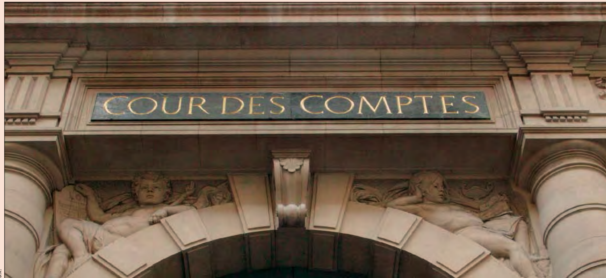
"Tout pouvoir exige un trésor, tout trésor exige un compte, et tout compte exige un juge désintéressé".

Comme chaque année, "Le Nouvel Economiste" vient de distinguer trois acteurs de la vie économique jouant des rôles différents mais particulièrement complémentaires. Dans la "Grand" chambre de la Cour des comptes, son président Philippe Seguin et Christine Lagarde ont réussi, mardi 18 décembre, devant une brillante assemblée, à donner une solennité justifiée à ce palmarès.