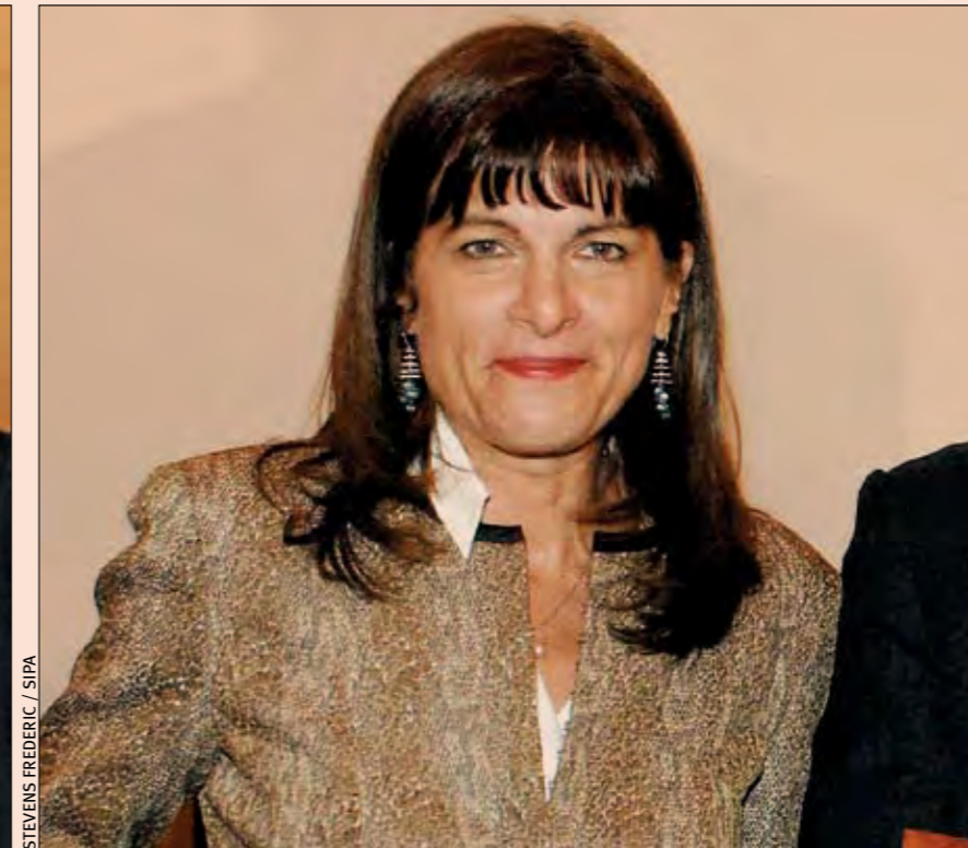
Anne Lauvergeon : "L'énergie est, avec l'eau et la nourriture, un des enjeux majeurs du XXIe siècle. On est revenu au triangle de base des besoins de l'humanité."