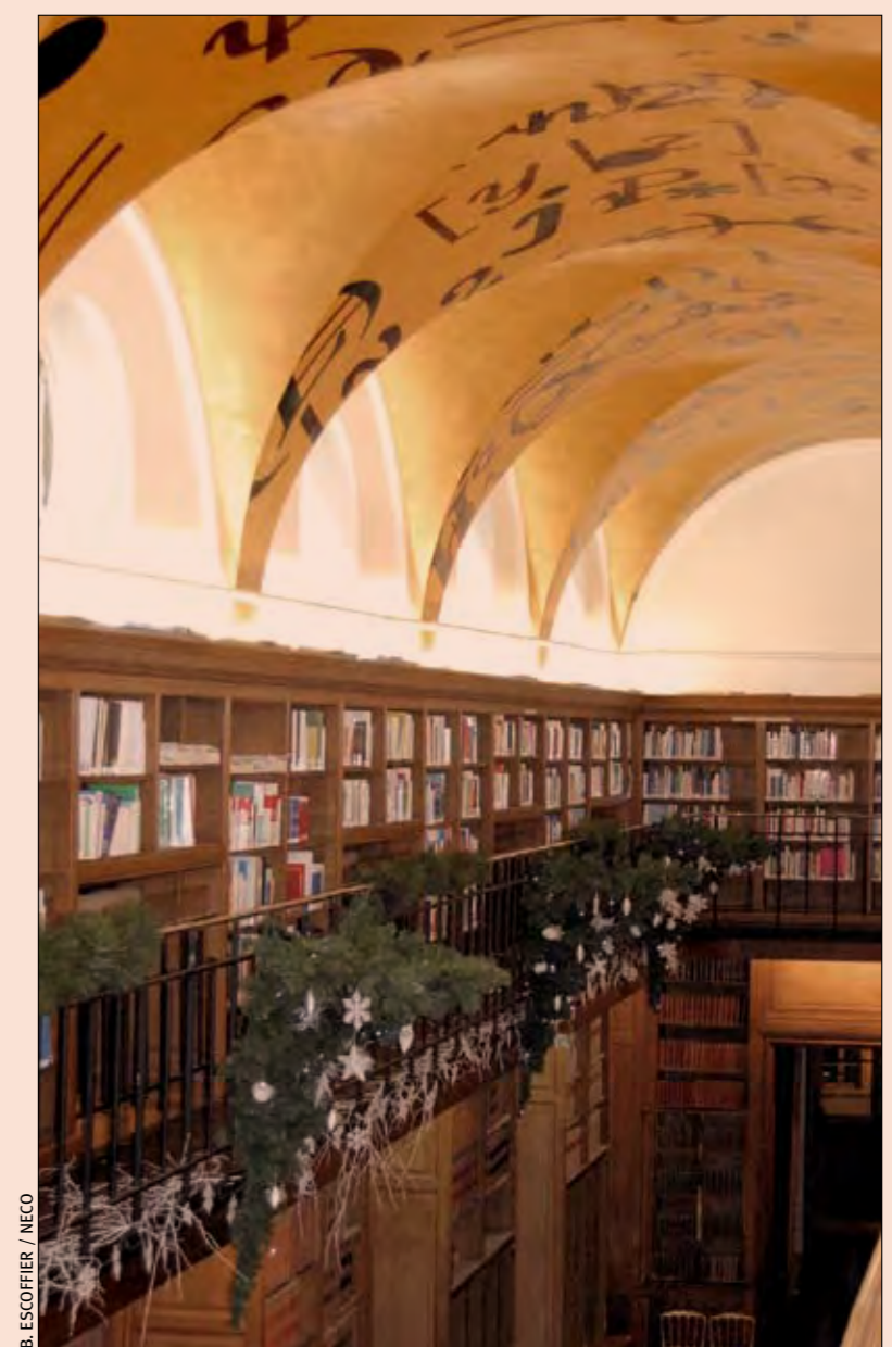
Philippe Seguin : "La cour s'efforce de dialoguer et pas seulement de juger, d'écouter, de persuader, de recommander, plus encore que de censurer ou de sanctionner."