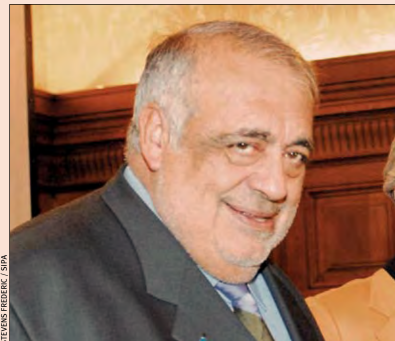
Philippe Seguin : "La Cour ne veut plus se contenter de tancer, de dénoncer et de fulminer, mais elle cherche à être un levier de la modernisation de l'Etat."

chait que sur une jambe, le support papier, va dorénavant fonctionner normalement sur deux jambes, support papier et support numérique, et va donc pouvoir reprendre sa marche en avant. Cette extraordinaire avancée est l'occasion pour nous, professionnels de l'écrit, de rappeler notre raison d'être première : ajouter de la valeur à une information existante à destination d'un lectorat hautement qualifié."