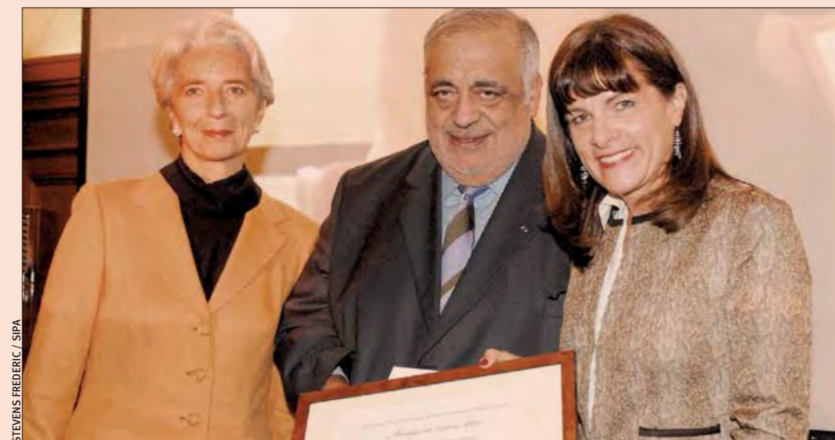
Christine Lagarde : "ce qui guide mon action, c'est l'ambition d'une plus grande compétitivité de la France. Elle passe par la productivité des entreprises, l'employabilité et l'attractivité du territoire."

brûlons ce que la terre a mis un million d'années à produire. Il faut nourrir à la fois des pays en développement mais aussi des pays développés, et tout ça, sous cette contrainte formidable du changement climatique. Arriverons-nous à fournir deux fois plus d'énergie avec deux fois moins de CO 2 ? C'est tout l'enjeu collectif d'Areva : l'énergie est un des biens fondamentaux de l'humanité. Il va falloir trouver des solutions pour chacun, chacun qui attend de l'électricité au moindre coût et sans renforcer les émissions de CO 2 .